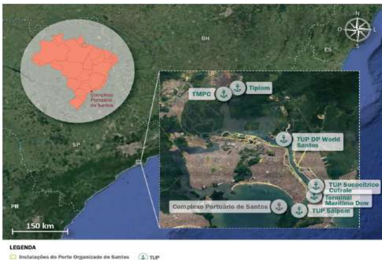
Figura 1: Localização do Complexo Portuário de Santos.

O Complexo Portuário de Santos está localizado nas cidades de Santos e Guarujá, no Estado de São Paulo, ao longo de um estuário limitado por esses dois municípios, que entra por cerca de 2 km do Oceano Atlântico. Suas instalações se estendem na Margem Direita (Santos) desde a Ponta da Praia até a Alamoia e na Margem Esquerda (majoritariamente, Guarujá) desde a Ilha de Barnabé até a embocadura do Rio Santo Amaro. Além disso, o município de Cubatão também abriga algumas instalações portuárias. A Figura 1 indica a localização das instalações portuárias do Complexo.