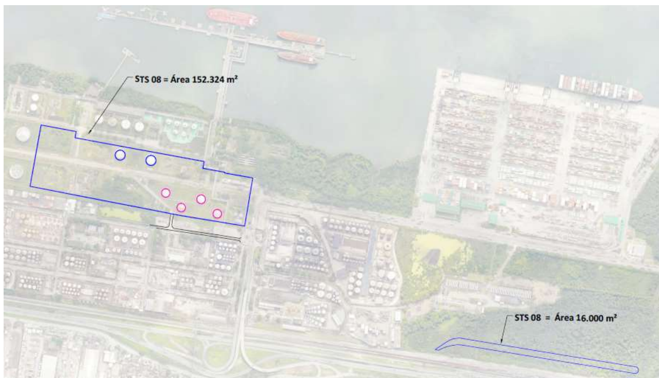
Figura 10 – Área de arrendamento STS08.

Para maiores informações, a Seção C – Engenharia detalha as premissas consideradas para a futura recomposição do terminal pelo vencedor da licitação.