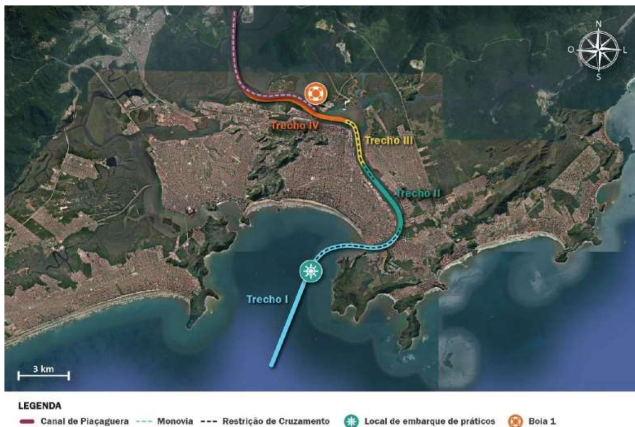
Figura 7: Canal de acesso do Porto de Santos..

De acordo com informações obtidas nas Normas e Procedimentos para as Capitânicas dos Portos de São Paulo (NPCP-SP), no roteiro da Marinha para a Costa Sul, nas Cartas Náuticas e informações fornecidas pela Companhia Docas do Estado de São Paulo (CODESP), o canal de acesso do Porto de Santos tem extensão de cerca de 25km e largura mínima de 220m, com traçado conforme figura a seguir.