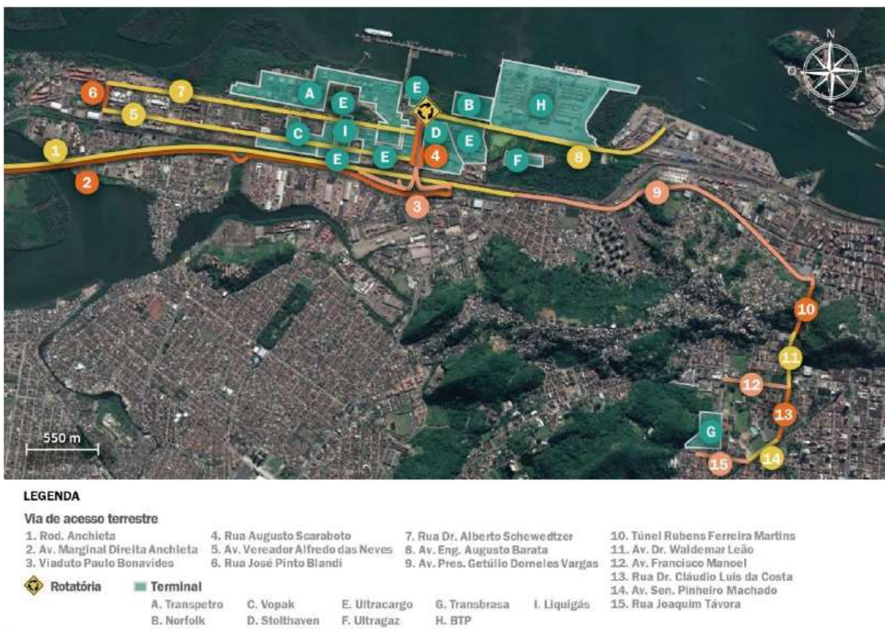
Figura 3: Vias do entorno portuário situadas na região da Alamoia e do bairro Jabaquara.

Tais acessos são ilustrados na Figura 3 e Figura 4.