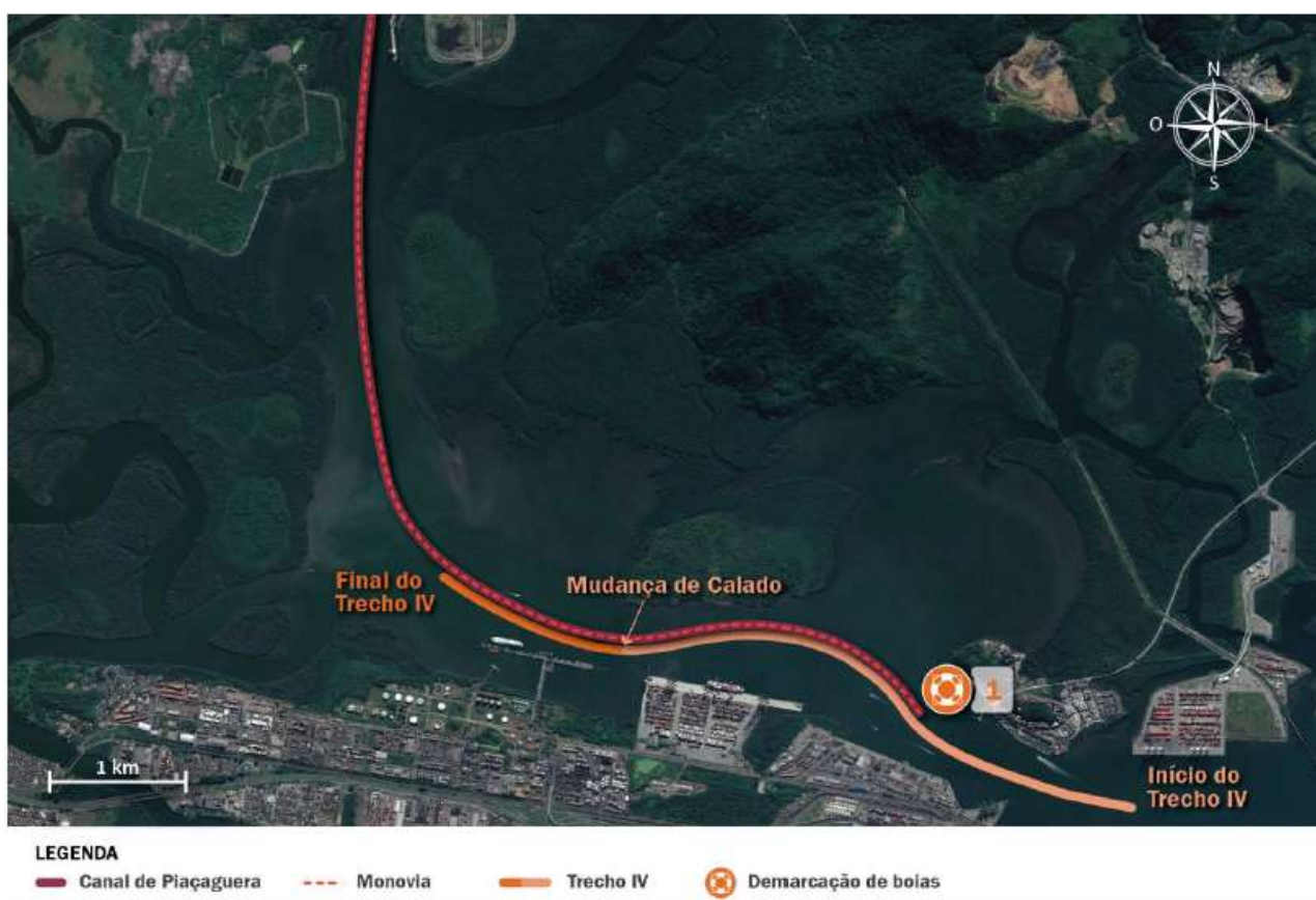
Figura 8: Trecho IV e Canal de Piaçaguera.

A Figura 8 ilustra o trecho IV do canal, localizado na frente dos terminais da Alamoia.