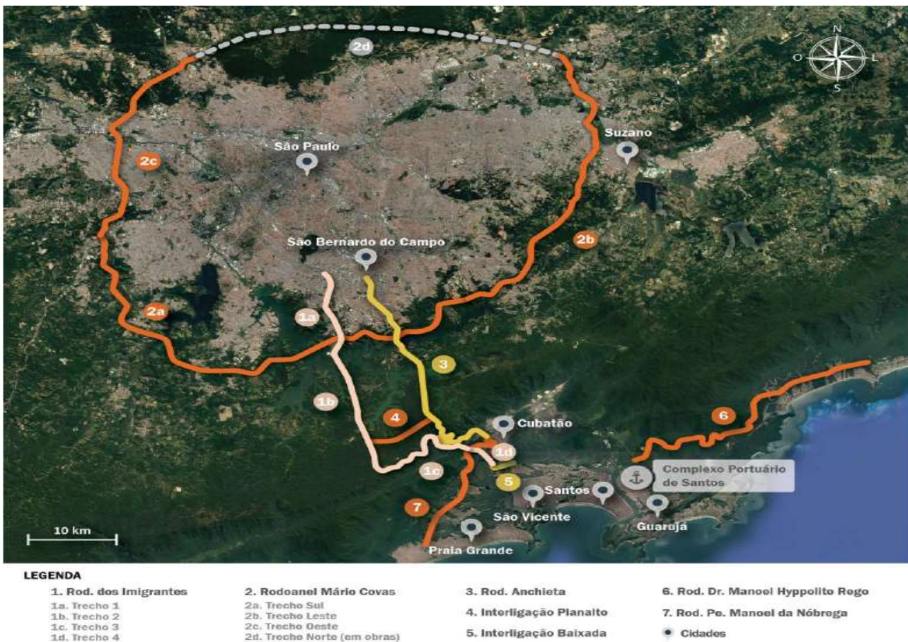
Figura 2: Visão geral da malha rodoviária – acesso ao Porto de Santos.

Uma parte importante desse sistema é operada por empresas concessionárias que cobram pedágios em diversos pontos das rodovias. A Ecovias é responsável pelo sistema Anchieta-Imigrantes, a CCR administra as rodovias Anhanguera, Bandeirantes, Dutra, Castello Branco, Raposo Tavares e o trecho oeste do Rodoanel, a OHL administra a Fernão Dias e a Régis Bittencourt, o DERSA administra o Rodoanel norte e a Nova Tamoios e o DER-SP administram as outras vias. A figura a seguir apresenta os acessos rodoviários ao Porto de Santos.