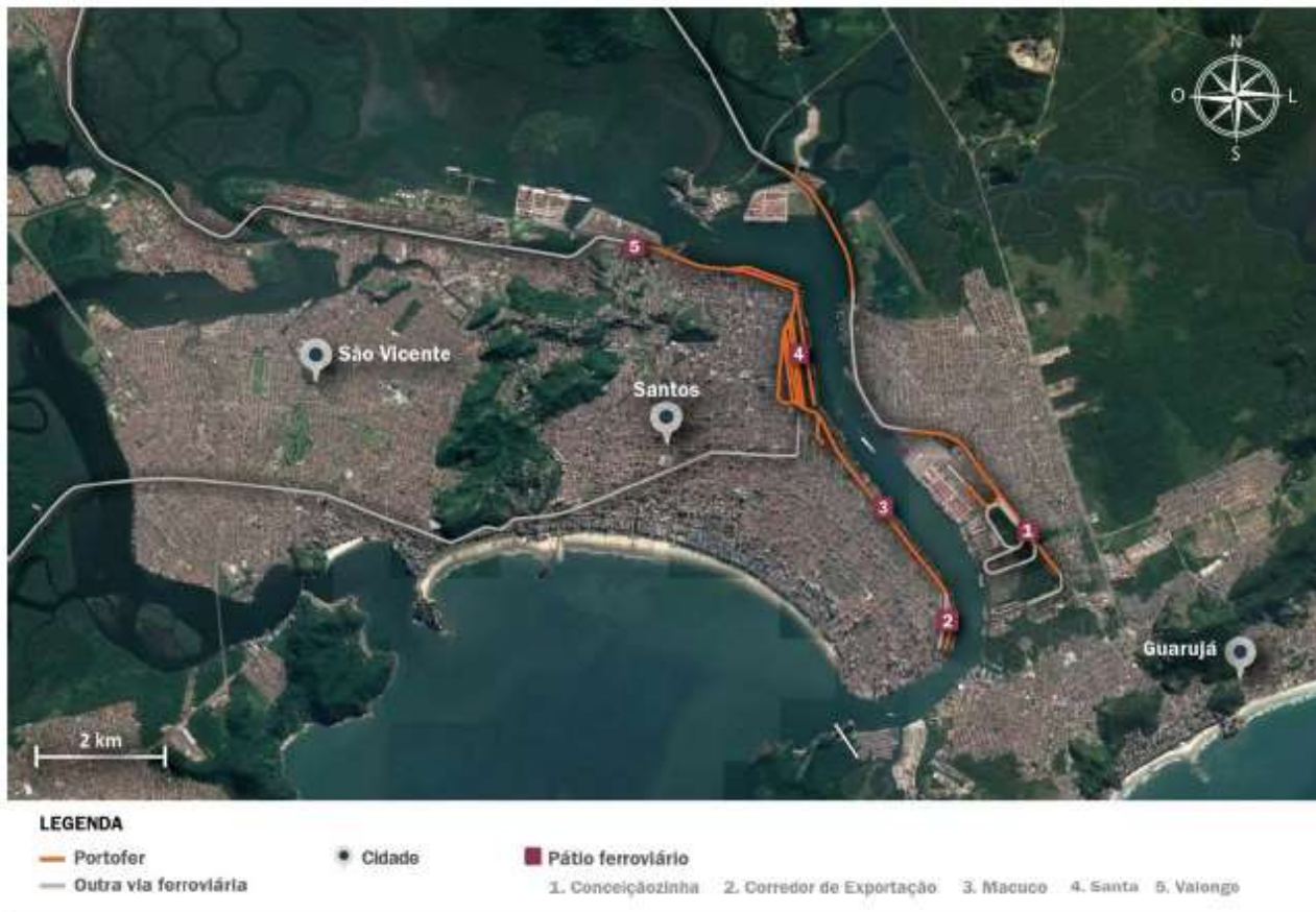
Figura 6: Malha férrea administrada pela Portofer inserida no Complexo Portuário de Santos.

A MRS opera com bitola de 1,60m e utiliza cremalheira para transposição da Serra do Mar. A RUMO MP tem bitola mista e utiliza sistema de simples aderência na Serra do Mar. A PORTOFER atua com bitola mista.