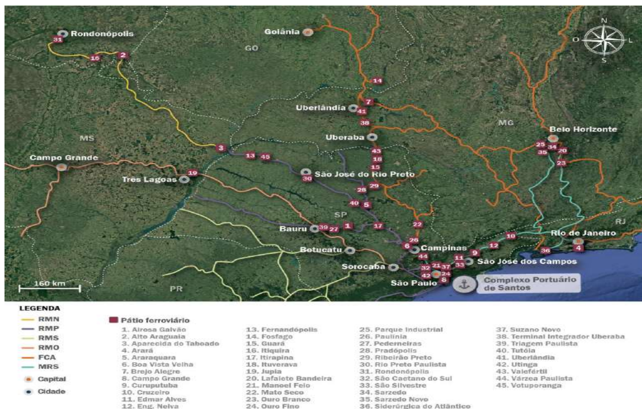
Figura 5: Acessos ferroviários ao Porto de Santos.

O acesso ferroviário ao Porto de Santos é composto pelas linhas da MRS Logística, FCA e Rumo (antiga ALL Logística) enquanto dentro dos limites do Porto, a operação ferroviária é feita pela PORTOFER.