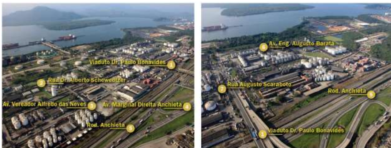
Figura 4: Vias de acesso na região da Alamoia.